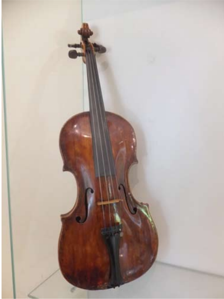
Vyskupo Antano Baranausko smuikas...