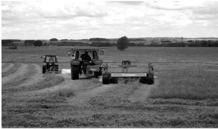
Žemės ūkio technika yra brangi ir vis brangsta, tad plėtoti savo ūkį be paramos – labai sunku.