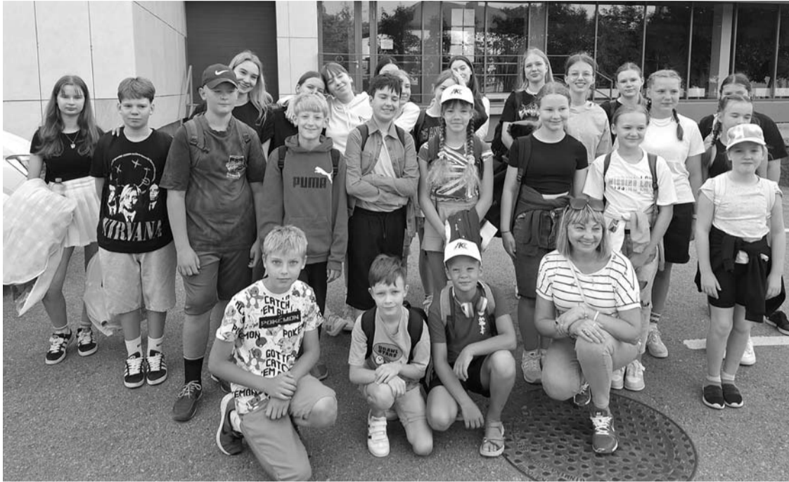
Mažųjų šokėjų kolektyvas į šimtmečio Dainų šventę išvyko pirmadienį.

Anykštėnams skirtos Pranciškaus Skorinos gimnazijos patalpos – jaunieji ir suaugusieji meno mėgėjai miegos klasėse, kabinetuose ir sporto salėse.